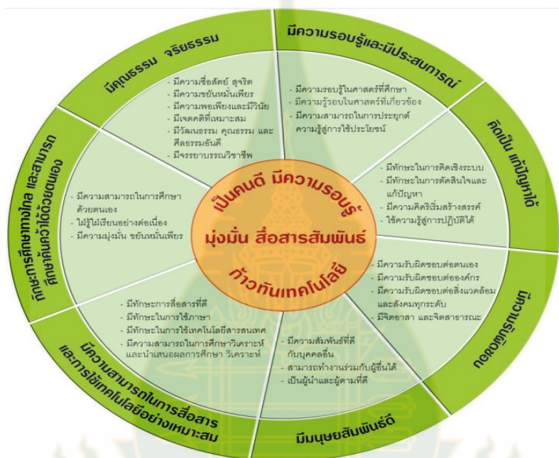
ภาพที่ 3 คุณลักษณะของบัณฑิตที่พึงประสงค์ มหาวิทยาลัยสุโขทัยธรรมมาธิราช

ทั้งนี้ มหาวิทยาลัยสุโขทัยธรรมมาธิราชได้มีประกาศมหาวิทยาลัยสุโขทัยธรรมมาธิราช พ.ศ. 2555 เรื่อง คุณลักษณะของบัณฑิตที่พึงประสงค์ มหาวิทยาลัยสุโขทัยธรรมมาธิราช พ.ศ. 2555 ให้ทุกสาขาวิชากำหนดคุณลักษณะของบัณฑิตทุกสาขาวิชา และเพิ่มเติมได้ตามศาสตร์ของแต่ละสาขาวิชา โดยมีพฤติกรรมจิตอาสาเป็นคุณลักษณะหนึ่งประการในภาพรวม โดยคุณลักษณะของบัณฑิตที่พึงประสงค์มีดังนี้